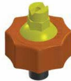
M3 Houder + mondstuk + dop